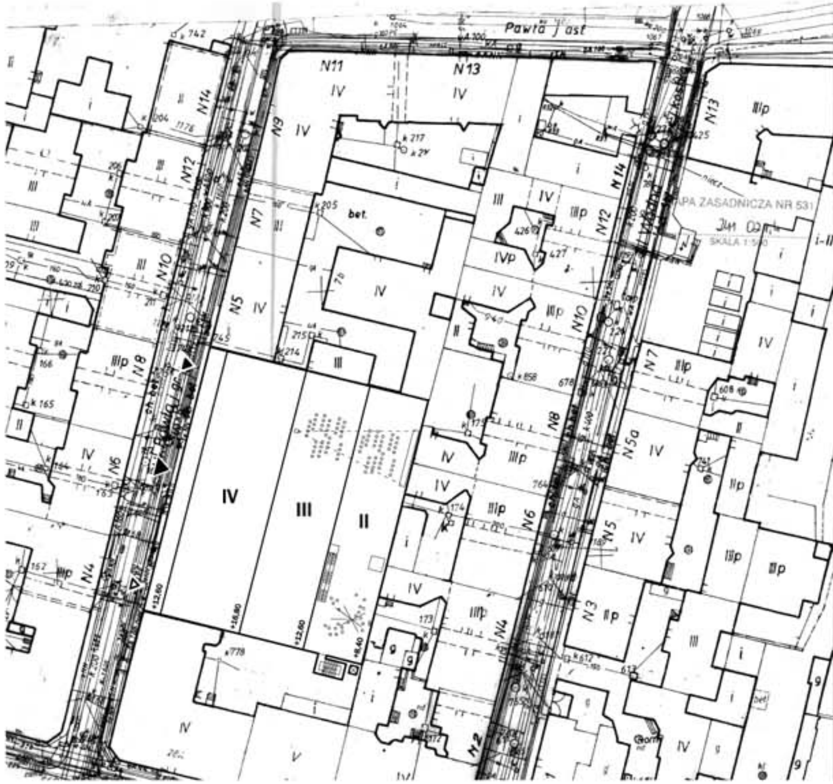
SYTUACJA SKALA 1:500