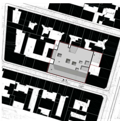
KULT - PARTER skala 1:100

Budynki planowane w tym miejscu zostały zaprojektowane w sposób zgodny z planem urbanistycznym i koncepcją architektoniczną, która została przyjęta w ramach konkursu. Projektant nie odpowiada za realizację projektu, który jest przedmiotem konkursu. Projektant nie odpowiada za realizację projektu, który jest przedmiotem konkursu. Projektant nie odpowiada za realizację projektu, który jest przedmiotem konkursu.