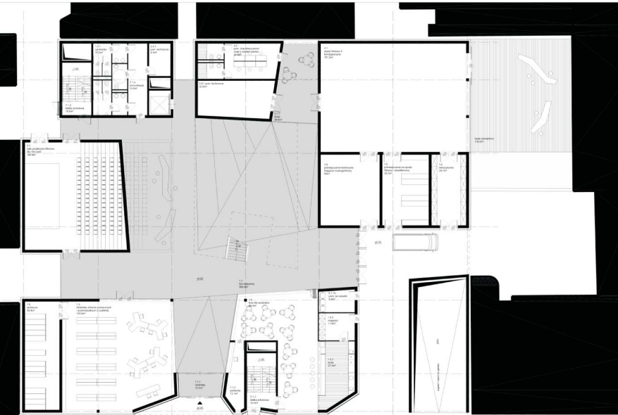
KULT - POCIOK 2 skala 1:100